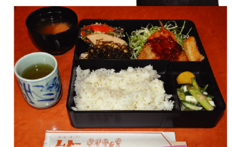
一番人気。おまかせ弁当700円