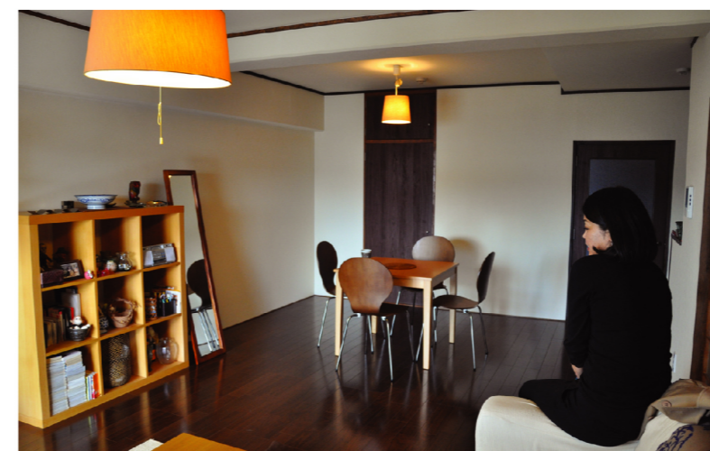
広いリビングダイニングキッチン(LDK)では、数人の友人を招き楽しいトークをしながらお酒を飲むこともあるという