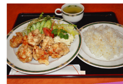
ボリューム満点! 唐揚げランチ880円