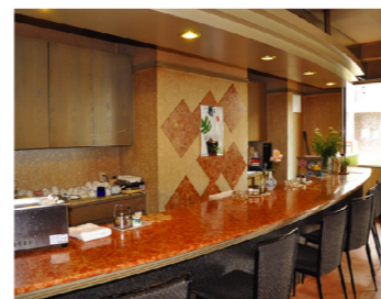
落ち着いた雰囲気店内でゆっくりできます。