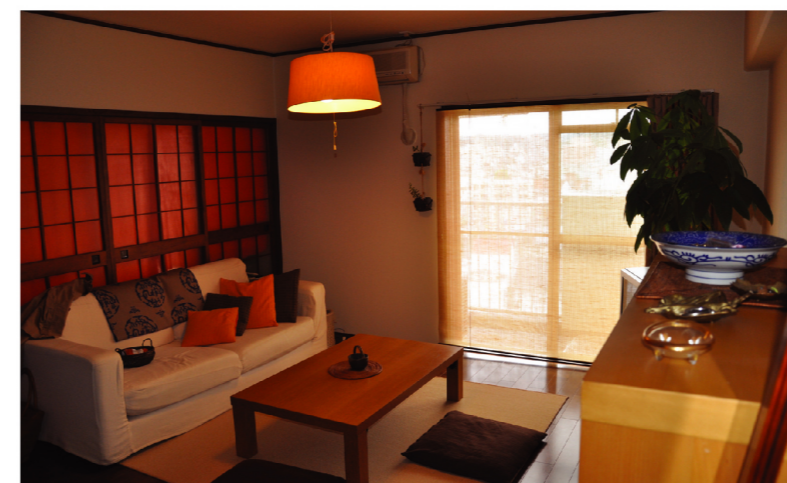
統一された配色バランスからAさんのセンスが感じられる

今まで高知市内で数回にわたりに引越しを繰り返してきたAさん。そのほとんどが、新築もしくは築3年の建物だったという。今回の部屋探しの条件は、職業柄時間を不規則な為、通勤距離を考慮し、「中心地に近く広い部屋で割安」を条件に探していた。そんな時、あるマンションをリニューアルしているという話を聞き、調べたところ、今ならフローリング&建具のカラーが選べることを知り、モデルルームを内覧、即決したという。