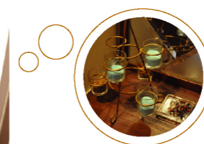
写真(下) フクウロには多くの意味があるという。是非、調べてみては...