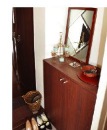
写真(上) 玄関には水色の壁とセージと呼ばれるハーブの一種を混ぜ合わせたものとパワーストーンが置かれている。これらは、玄関から入ってくる邪気を浄化してくれる作用があるとのこと。

今まで高知市内で数回にわたりに引越しを繰り返してきたAさん。そのほとんどが、新築もしくは築3年の建物だったという。今回の部屋探しの条件は、職業柄時間を不規則な為、通勤距離を考慮し、「中心地に近く広い部屋で割安」を条件に探していた。そんな時、あるマンションをリニューアルしているという話を聞き、調べたところ、今ならフローリング&建具のカラーが選べることを知り、モデルルームを内覧、即決したという。